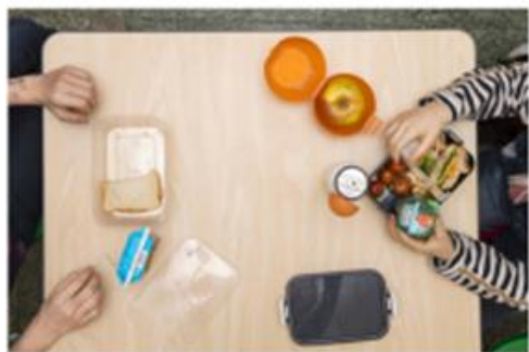
Het publieke geld heeft een belangrijke rol te spelen bij de schoolkantine. Het is belangrijk om te zorgen voor een goede voeding voor de kinderen. Dit kan door de schoolkantine te ondersteunen.

Klaas Meerhoff Vrijdag 1 oktober 2021 om 17:00 uur