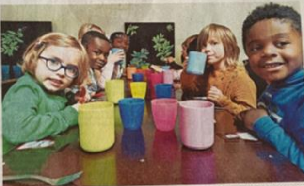
Kinderen op basisschool Crombeek krijgen een tasje soep bij de warme maaltijd. De school haalde al geld op voor 1.000 warme maaltijden.

Niet elk kind krijgt een (gezond) gevulde brooddoos mee naar school, maar elk kind heeft recht op een maaltijd. Met die boodschap zijn acht scholen van het Gentse katholieke net aan de slag gegaan. Het resultaat: duizenden brooddozen die gevuld worden, tassen soep en warme maaltijden die worden uitgedeeld. Niet wij, maar Vlaanderen zou een warme maaltijd moeten voorzien.